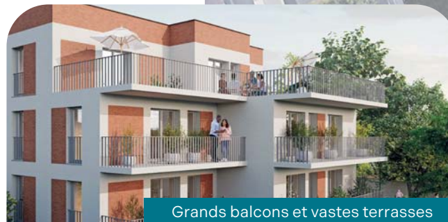
Grands balcons et vastes terrasses

Les Jardins de la Marne incarnent un art de vivre où la nature se conjugue avec le confort, où chaque détail contribue à créer un environnement d'exception.