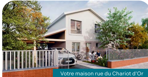
Votre maison rue du Chariot d'Or

L'entrée de la résidence rue du Canada , conduit les véhicules vers les aires de stationnement extérieur ou le parking en sous-sol, tandis que les allées minéralisées guident les résidents vers les halls d'entrée et les appartements .