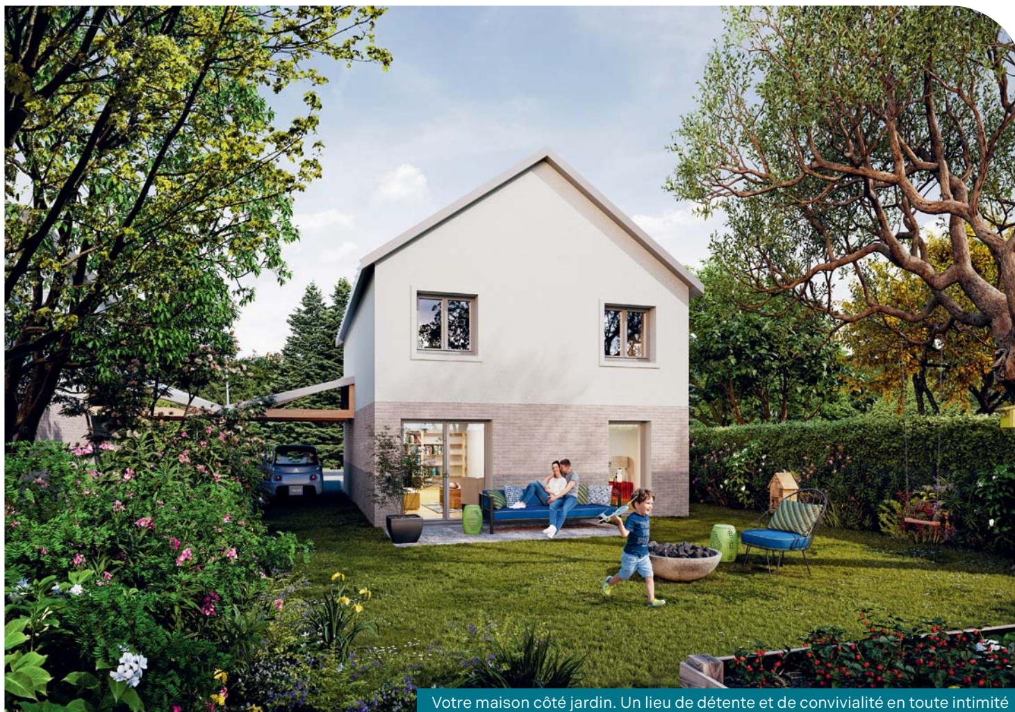
Votre maison côté jardin. Un lieu de détente et de convivialité en toute intimité

Empruntant des allures de petit hameau, les 13 maisons de 4 ou 5 pièces (1) sont agencées pour offrir un univers à la fois chaleureux et convivial.